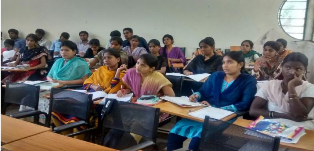
పత్రాలను వింటున్న విద్యార్థులు